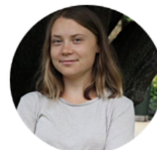
Greta Thunberg Fridays for Future